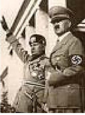
Hitler & Mussolini

belirli görevlendirmelerde bulunmaları ya da örgüt olarak açıklama yapmaları bilgi karmaşasını önlemek adına yararlı olabilir.