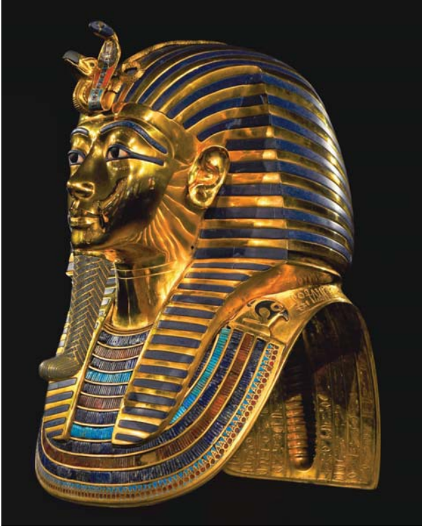
Şekil 1. Tutankhamon maskesi

ailesinin mensubu olmayan kişilerin bile hayattayken tak-tıkları yüzükler ve kolyelerle mumyalandıkları görülmektedir.