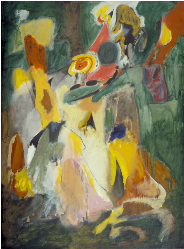
Waterfall (Arshile Gorky, 1943)

Ahlaki Temeller Kuramı'na dayandırılan bir çalışmada, so-